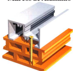
Marcos de Aluminio